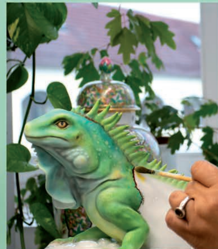
Iguana 16161000 CD

Hogy ez a naturalisztikus termék még élethűbb legyen, a kivitelező festő egy új, eddig még nem használt festési módszert alkalmazott: az iguana figura egy különleges szivacsoszási technikának köszönhetően hasonlít megtévesztésig a természetben található hullőre.