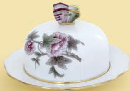
04 Vajtartó 00393017VICTF2