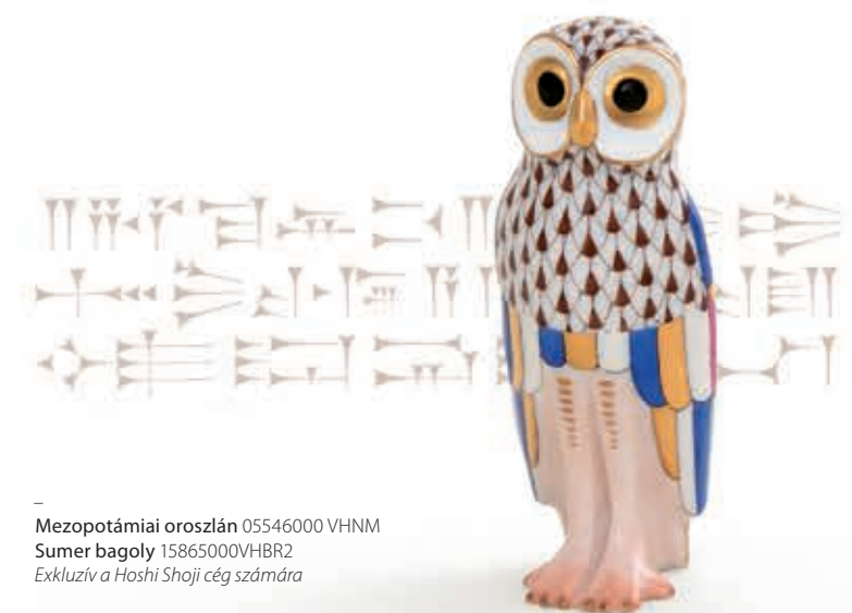
Mezopotámiai oroszlán 05546000 VHM8 Sumer bagoly 15865000VHBR2 Exkluzív a Hoshi Shoji cég számára

Az éjszakát egy hajón töltjük, ugyanis vízre kell szállnunk, hogy az Eufráteszen eljussunk Uruk városállamba. Urukot a sumerek alapították, a város nevéhez pedig számos innováció fűződik, többek között az írás tudománya is, amelyet a helyi iskolában tanítanak. A képekből és szimbólumokból álló írás helyett itt ugyanis már ékírást használnak – bár az egyiptomiakkal vitáznak azon, hogy kik találták ki hamarabb. Az uruki íráshoz puha agyagtáblákat használnak, a szöveget azokba karcolják bele nádszárakkal, majd a napon kiszáritják vagy kiégetik őket. Egyszerűnek tűnik, de azért az Uruk királyáról, Gilgamesről szóló eposz (ez az emberiség egyik legrégebb írott forrása) lejegyzése sokáig tarthatott... A gazdag kereskedőváros tucatnyi bazárja arra csábít, hogy szuveníreket szerezzünk be, de ha nem is találunk semmit, ami megfelelne az ízlésünknek, egy biztos: a civilizáció ajándékával térünk majd haza.