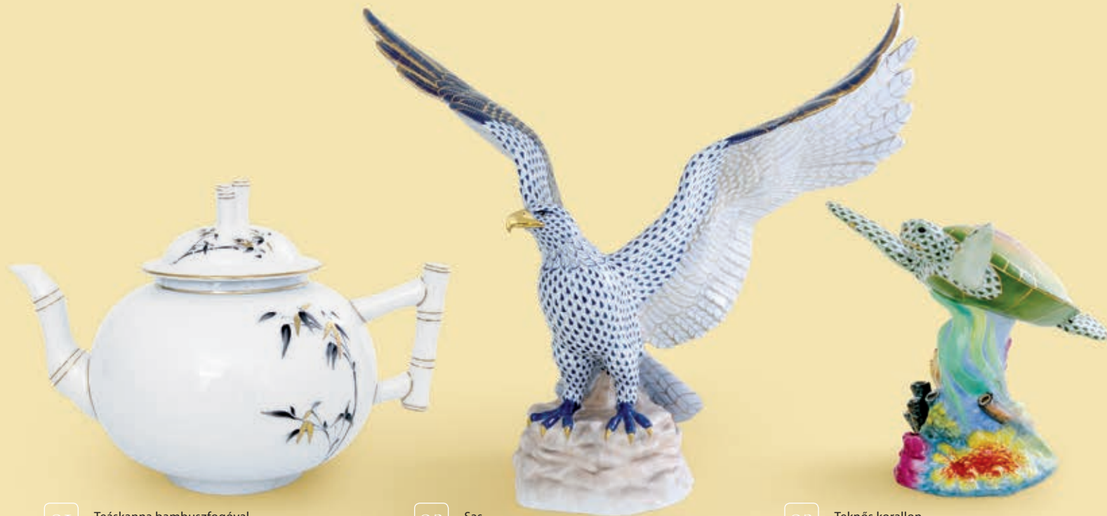
01 Teáskanna bambuszfogóval 03402091SAJU

Egy szín, egy motívum, egy forma – annyi mindenről eszünkbe juthat a szeretett személy. Fejezzük ki odafigyelésünket olyan meglepetéssel, amely méltó szimbóluma lehet a kapcsolatunknak.