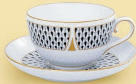
06 Teáscsésze aljjal 02703100VHNKN, 02703200VHNKN