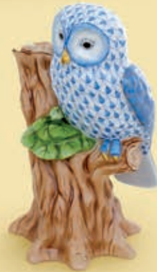
05 Bagoly ágon 05831000VHBM+C