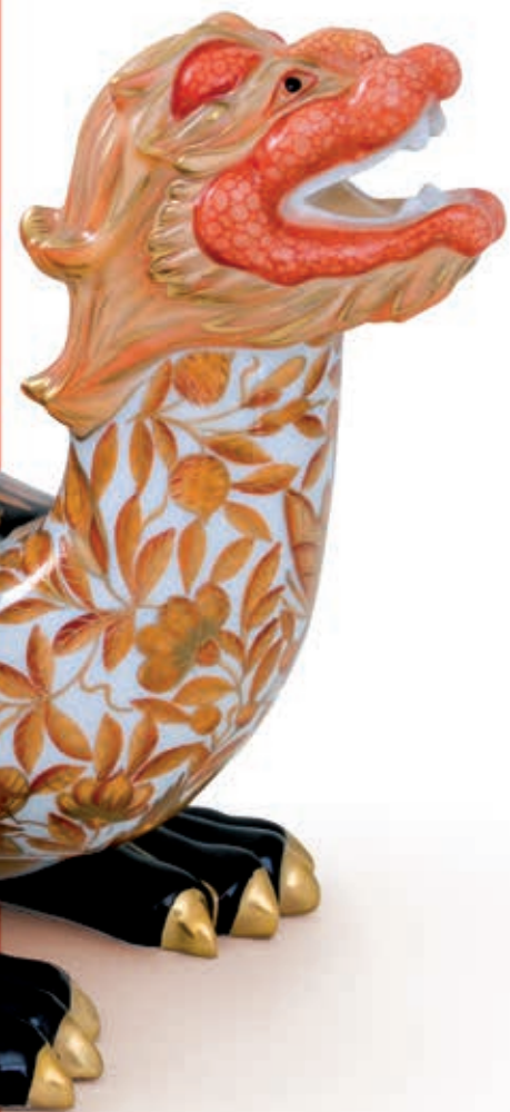
Sárkányteknős, kicsi 5947000 ZOVT-5 Tálka madárral I. 7562091 VHM Teáskanna csavart fogóval 20606006 VH

A korallok fontos szerepet játszanak az ökoszisztéma egészséges működésében, és nem utolsósorban szemkápráztató látványt nyújtanak. Az élő korall pedig egy olyan különlegesen szép színárnyalat, amelyet érdemes a mindennapjainkba is becsempészni. Otthonunkat egyszerűen trendibbé és vidámabbá tehetjük vele, hiszen a natúr és a hideg tónusokkal is rendkívül jól kombinálható. Kezdetnek például beszerezhetünk néhány korallvörös kiegészítőt: törölközőt a fürdőszobába, díszpárnákat a nappaliba és porcelántányérokat az étkezőbe. Aztán ha a játékoságot és optimizmust sugárzó árnyalatot kellőképpen megkedveltük, akkor érdemes a gardróbunkat is feldobni vele. Az élő korallvörös remekül mutat a hozzá hasonló színekkel, a pink és a narancs összes árnyalatával, akár csak a komplementer színével, a tengert idéző türkizkékkel és minden arany fényű kiegészítővel – nyárra tökéletes.