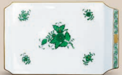
06 Sajttálca 2459000 AV