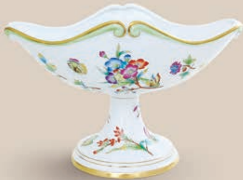
04 Gyümölcssárvány 7410000 VICTVT