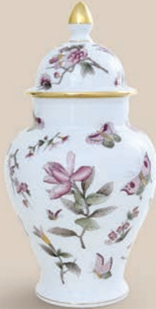
02 Váza gomb fogóval 6572015 VICT2