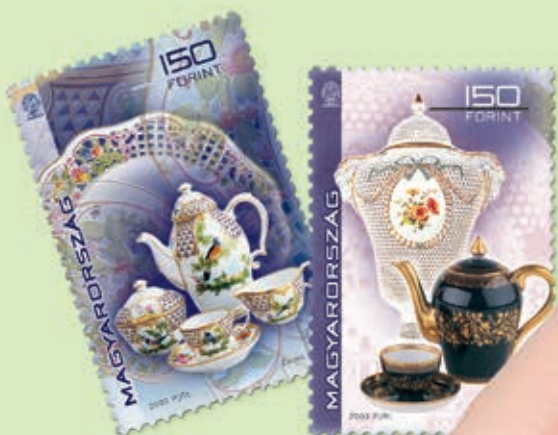
Középen: A Herendi Porcelánmanufaktúra alapításának 150. évfordulójára 1976-ban kiadott bélyeg