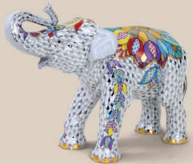
03 Ázsiai elefánt, nagy 15487000 VHSP106