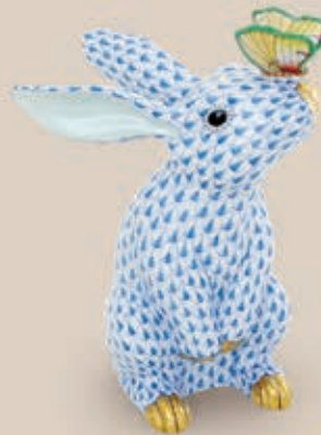
05 Nyúl orrán lepkével 5728000 VHB