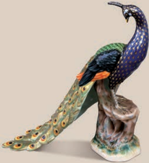
01 Páva 5690000 VHSP38

Sok odafigyelést és törődést igényelnek az emberi kapcsolatok, viszont ha nem sajnálunk rászánni egy kis időt, sokszorosan meghálálja magát a befektetett energia.