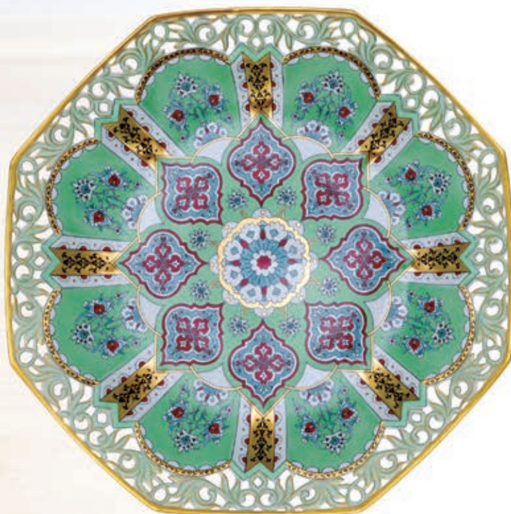
Váza gomb fogóval 6576015 SP983 Dísztal, falitál, áttört 8393050 SP983